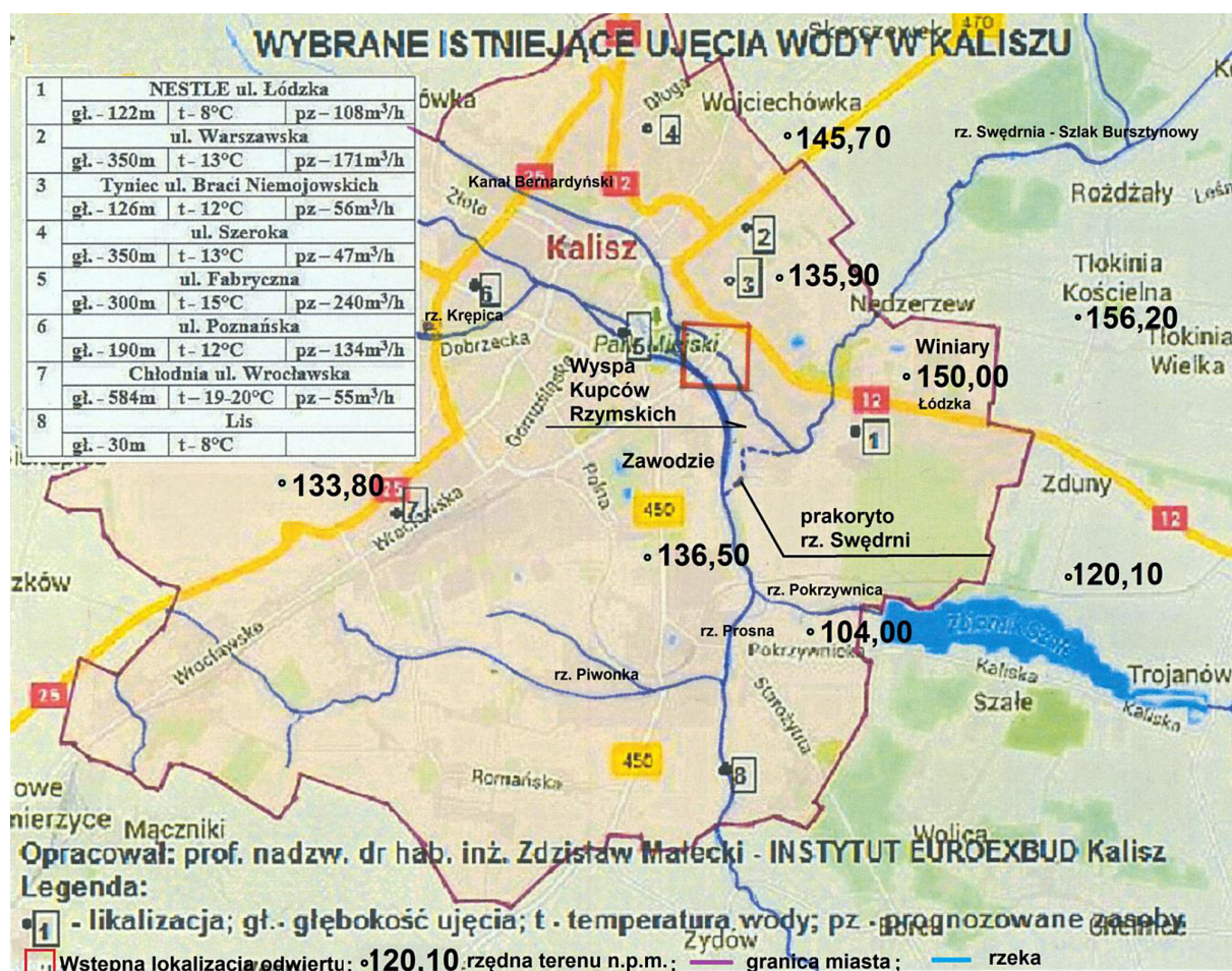
Mapa 3. Wybrane istniejące ujęcia wody w Kaliszu